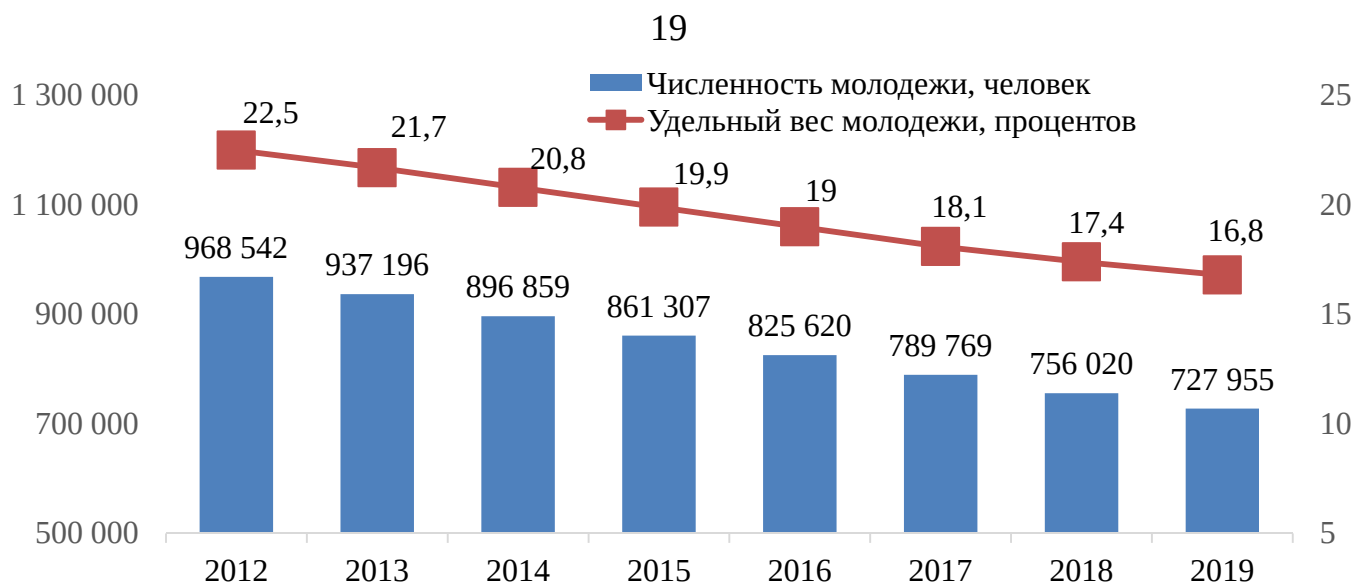
Рис. 3. Численность молодежи в Свердловской области за период 2012–2019 годов